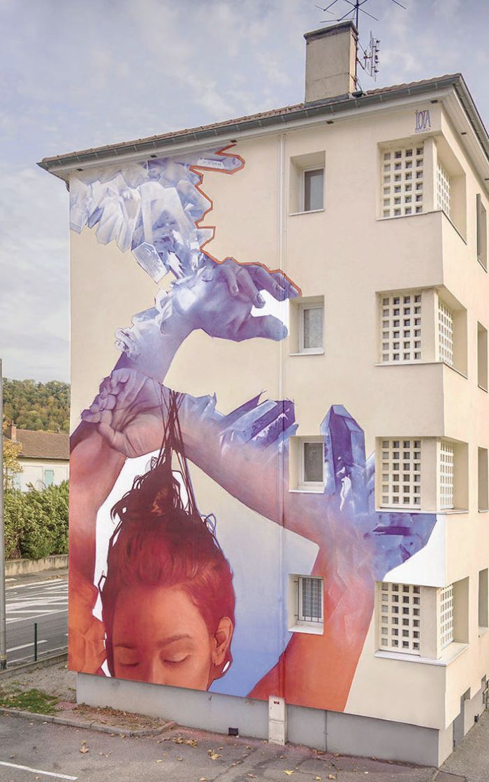
Old skin Grenoble street art fest. Octobre 2020.